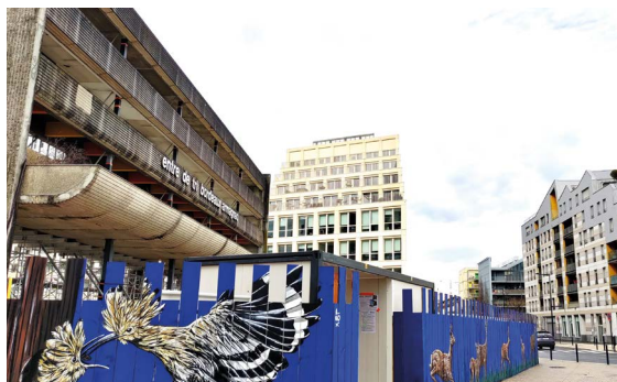
La façade de l'ancien centre de tri postal de Bègles va devenir celle d'un hôtel