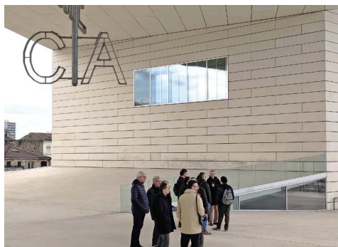
Le groupe termine la visite sous l'arche de la MECA