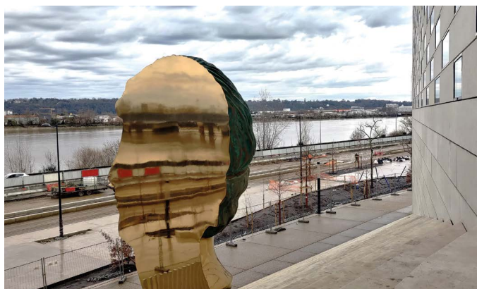
L'espace en bord de Garonne sera végétalisé et ouvert aux mobilités actives (piétons, cyclistes, trottinettes...)