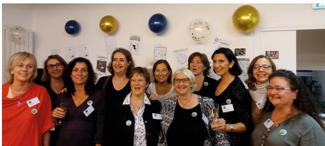
Les filles de la promo TP91 en force (90% de présentes)

Merci à nos sponsors : Comodis, Soredal, Cabinet Daumin Coiraton-Demerciere Eiffage TP et à la Maison des Alumni ESTP