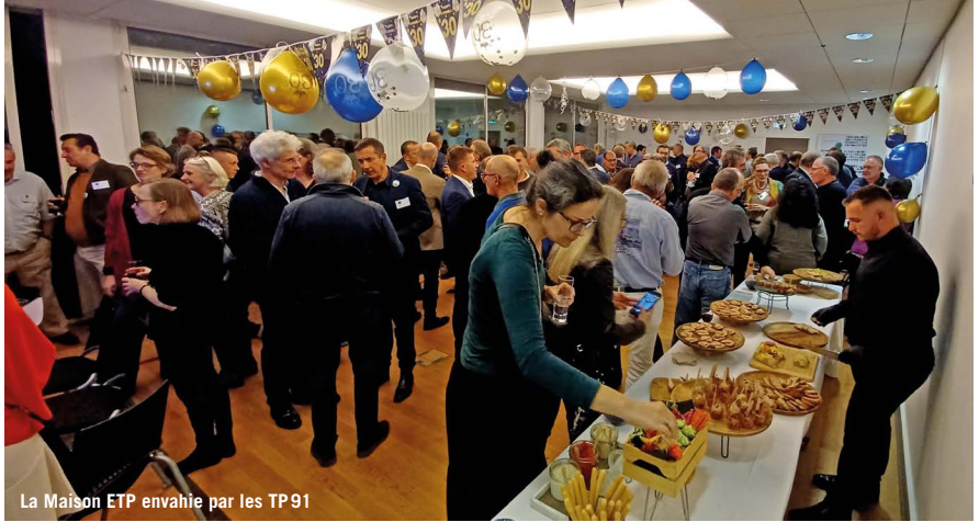
La Maison ETP envahie par les TP91

Merci à nos sponsors : Comodis, Soredal, Cabinet Daumin Coiraton-Demerciere Eiffage TP et à la Maison des Alumni ESTP