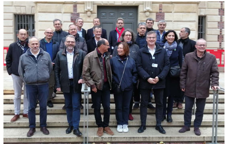
Photo de groupe lors de la visite préalable à la soirée : Bibliothèque Nationale

L'intensité du mouvement brownien des regroupements était moins puissant que dans les soirées