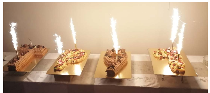
Le gâteau TP91