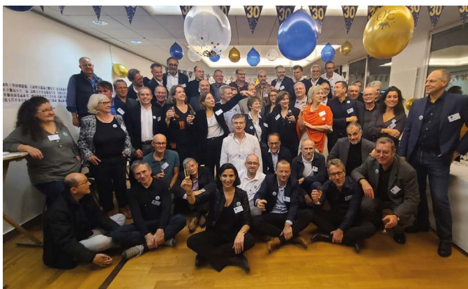
Traditionnelle photo de groupe